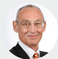
Par Marc St-Pierre CFA Membre du Comité de placement PHARE